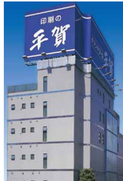
第三ビル(デジタル館)