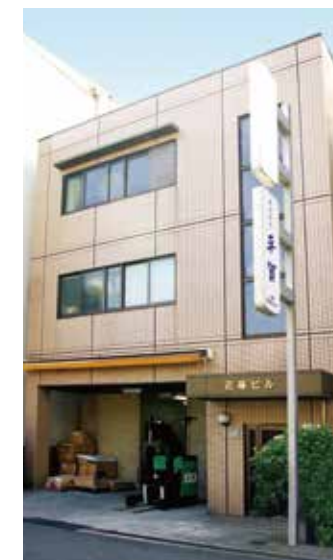
大阪配送センター